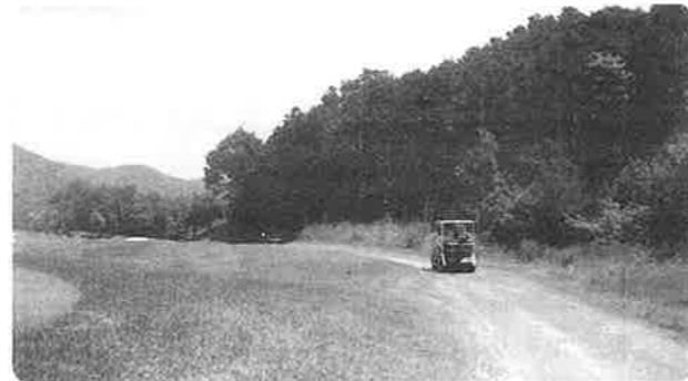
〈ゴルフ場内を走る特別運搬車輦〉

年代古墳(国史跡)、貞丸1～2号古墳(県史跡)。楽音寺・東禅寺・永福寺、さらに佛通寺・米山寺など。沼田地方の歴史絵巻物がくりかえされるようで、本郷町内の寺院史を論考することが今後の課題であろう。